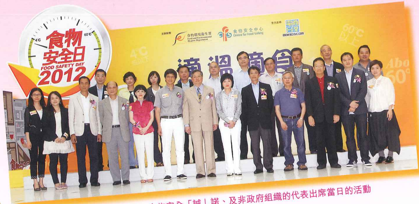
一眾來自食物業協會、食物安全「誠」諾、及非政府組織的代表出席當日的活動

正確溫度是確保食物安全的關鍵，因此，向市民推廣此信息極為重要。食物安全中心本年度的「食物安全日」主題為「適溫適食」，旨在宣傳以正確溫度貯存食物，確保食物安全。中心邀請到簽署食物安全「誠」諾的食物業界代表參與，表揚他們對食物安全「誠」諾的支持。