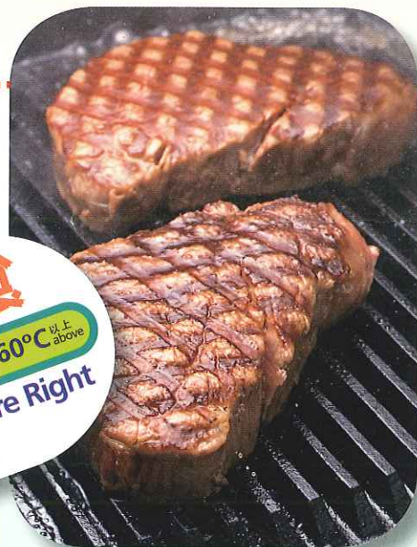
生的食物要徹底煮熟才可食用