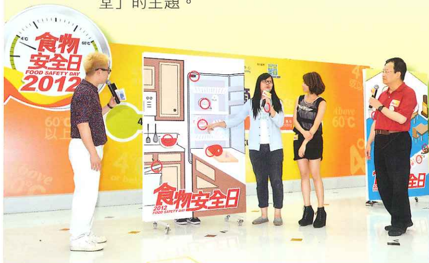
現場觀眾熱烈參與食物安全遊戲

中心亦於五月至八月期間，舉行多場公眾講座，講解食物安全的議題，包括適溫適食、善用營養標籤、踢走食物中的異物，以及食物事故及風險認知。