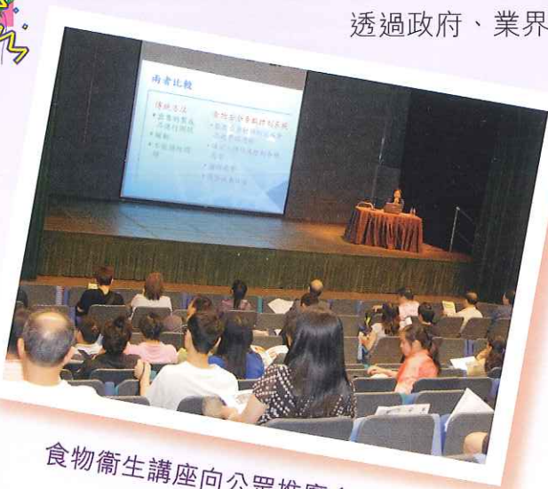
食物衛生講座向公眾推廣食物安全

透過政府、業界及公眾三方面的通力合作和積極參與，可提昇本港的食物安全水平。為提高市民的食物安全知識，食物安全中心於七月及八月期間舉辦四場以「食物安全五要點」為主題的二零一二年度食物衛生講座(公眾篇)，以深入淺出的形式講解「食物安全重點控制」及正確處理食物的方法。講座免費入場，供公眾人士及食物業從業員參加。講座會以粵語進行。所有參加者獲頒出席證書及獲贈精美紀念品。有關詳情請瀏覽食物安全中心網頁 ( www.cfs.gov.hk )。